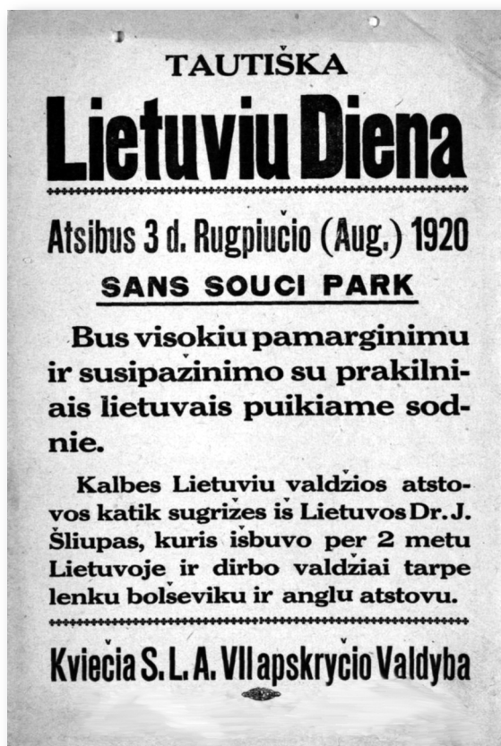
Plakatas, kviečiantis į gegužinę, 1920 m.