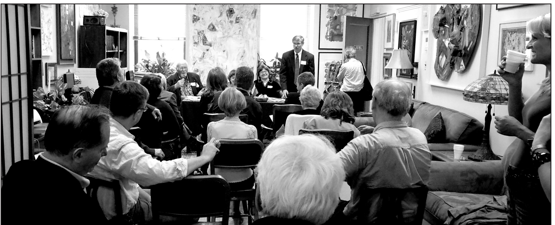
General view of plenary session of LAA's Special Convention held at home office. President Saulius Kuprys presiding.