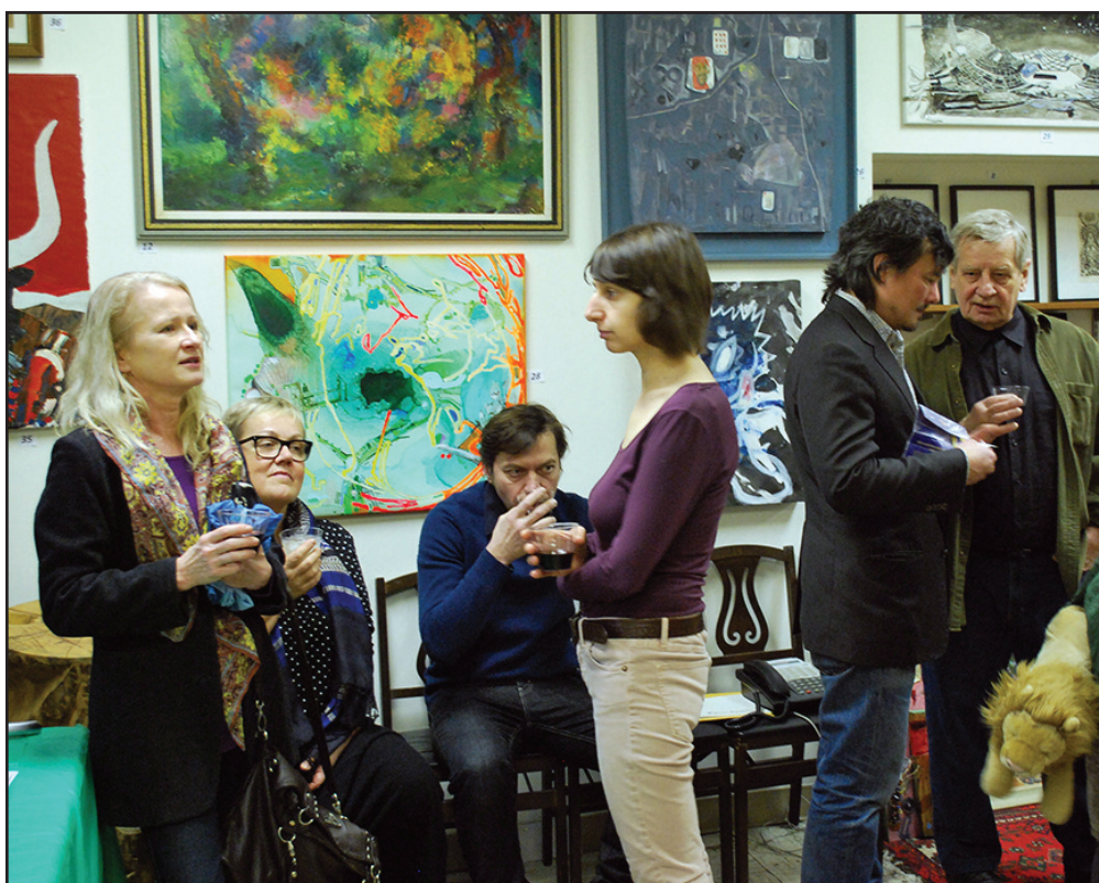
Vaizdas iš menininkų ir aukotojų priėmimo SLA pastate New Yorke.