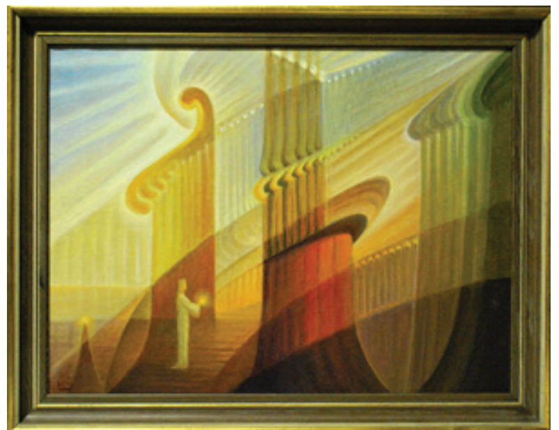
Kazys Šimonis. Be pavadinimo . 1969, aliejus/oil