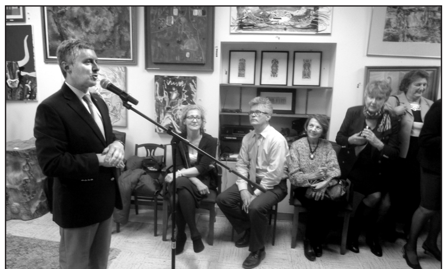
Consul General of Lithuania in New York Valdemaras Sarapinas addresses community representatives during the reception for Foreign Minister Linas Linkevičius.