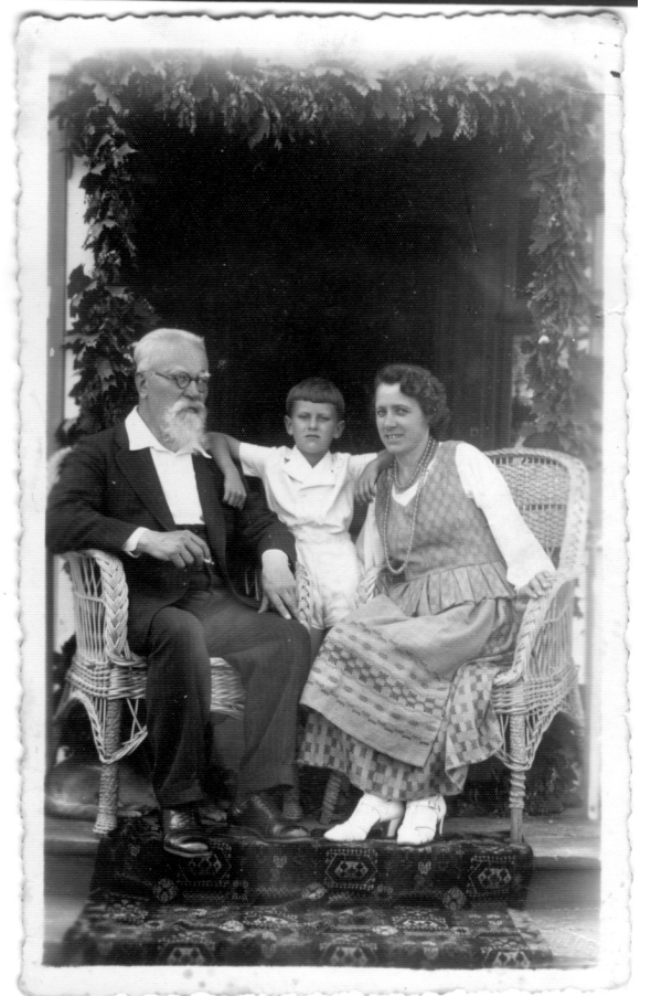
Dr. Jonas Šliūpas su žmona Gracilda ir sunumi Vytu.

Dr. Jonas Šliūpas laikomas kontroversine, audringa bet labai stipria asmenybe. Tai patvirtina M. Biržiškos žodžiai: „Apie Šliūpą, kaip apie didžiulį ugnikalnį, visą laiką sukinėjosi juodi debesys. Žaibai trankė jo viršūnę ir audringai lietūs plovė jo šlaitus. Bet laikui bėgant debesys išsisklaidė ir išnyko, o ugnikalnis išliko nepajudinamas, nepasikeitęs. Toks jis ir liks per amžius, kuriuomi grožėsis žmonija...“ Iš tiesų, galima pasidžiaugti, jog ši asmenybė sulaukė ir svarbių valstybinių įvertinimų. Be jau minėtų ordinų, dr. J. Šliūpas dar buvo apdovanotas Latvijos Trijų žvaigždžių 2-ojo laipsnio ordinu (1932 m.), Savanorio medaliu (1936 m.), Klaipėdos išvadavimo sidabro medaliu. Dr. J. Šliūpas yra bene vienintelis asmuo, kuriam Vytauto Didžiojo universitetas (jame 1925–1930 m. dėstė medicinos istoriją) yra suteikęs net tris garbės daktaro laipsnius: 1923 m. – medicinos, 1925 m. – humanitarinių mokslų, 1939 m.