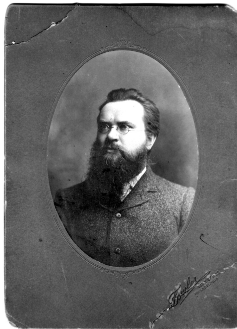
Dr. Jonas Šliūpas Amerikoje

jis dalyvavo Stokholmo lietuvių konferencijoje, skelbdamas, kad Lietuva turi būti visiškai nepriklausoma. 1918 m. rugpjūčio 29 d. JAV Senato posėdžių protokoluose išspausdintas