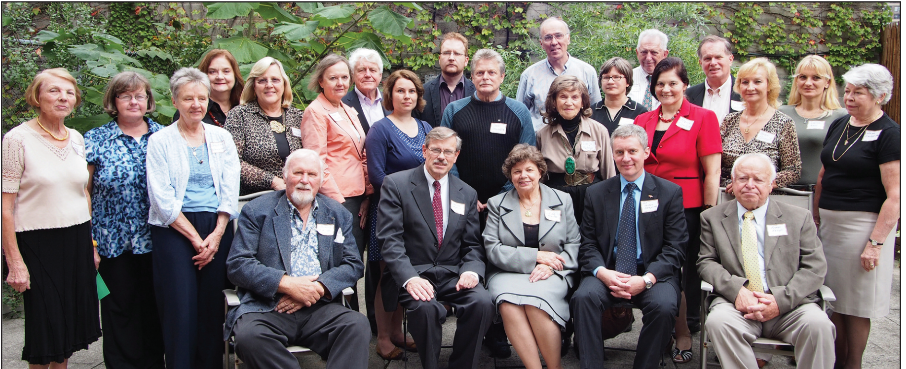
70-tojo SLA seimo atstovai ir svečiai, Susivienijimo Lietuvių Amerikoje pastato darželyje, New Yorke. Delegates and guests of the 70th National Convention of the Lithuanian Alliance of America in the courtyard of the Lithuanian Alliance of America Building in New York City.