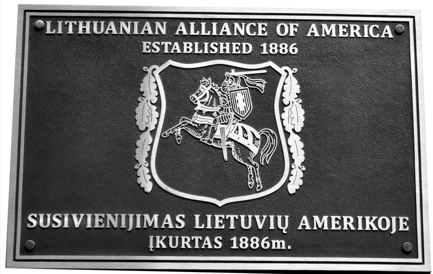
The new LAA plaque is a gift from the Foreign Ministry of the Republic of Lithuania. It features the traditional Lithuanian coat-of-arms – the mounted knight

Renew your membership in the Alliance. See page 11.